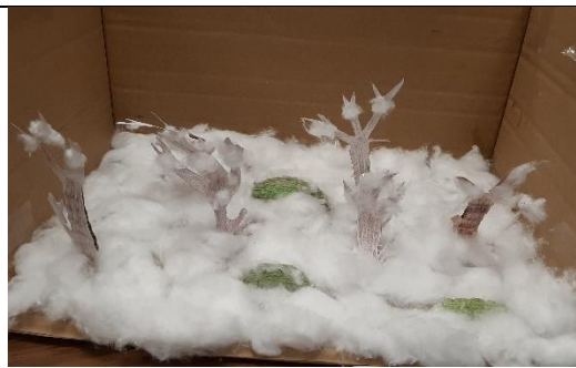
Un décor du conte des 6è7